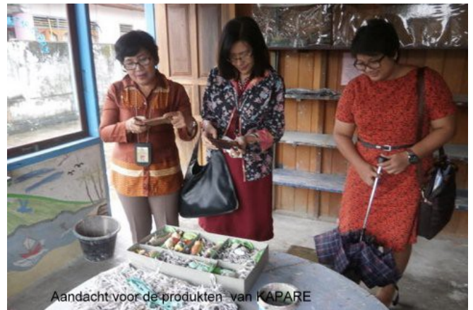
Aandacht voor de produkten van KAPARE